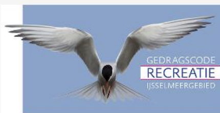
Gedragscode recreatie IJsselmeergebied