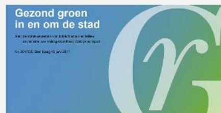
Advies Gezondheidsraad: Gezond groen in en om de stad