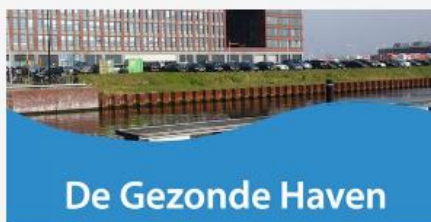
Schetsboek De gezonde haven