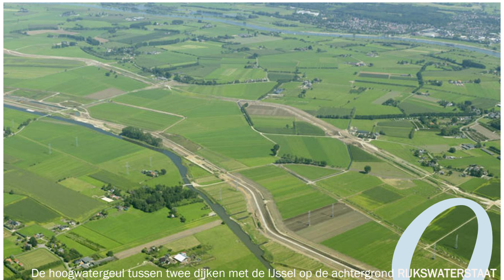
De hoogwatergeul tussen twee dijken met de IJssel op de achtergrond

Als de hoogwatergeul wordt gebruikt, zakt de waterstand in de IJssel 71 centimeter. Van alle projecten die Nederland de afgelopen jaren heeft ondernomen om overstromingen te voorkomen, heeft de hoogwatergeul daarmee de meeste impact op de waterstand.