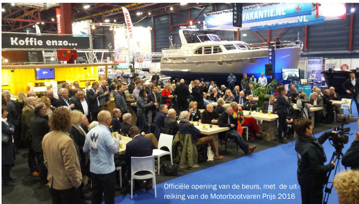
Officiële opening van de beurs, met de uitreiking van de Motorbootvaren Prijs 2016

Voor de opening van de beurs op vrijdag 10 februari jl. werd er al genetwerkt op de stand van het VNM.