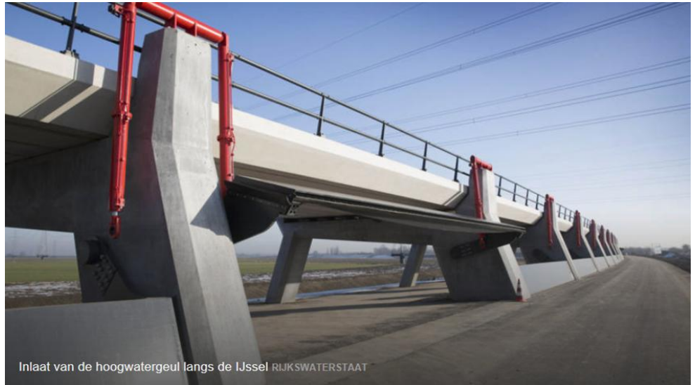
Inlaat van de hoogwatergeul langs de IJssel RIJKSWATERSTAAT