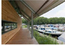
Uitsnede situatie Jachthaven Achter 't Veer