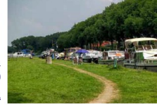
Links: Referentie grasveld met passantenligplaatsen (Heuskeum)