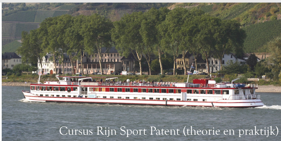
Cursus Rijn Sport Patent (theorie en praktijk)